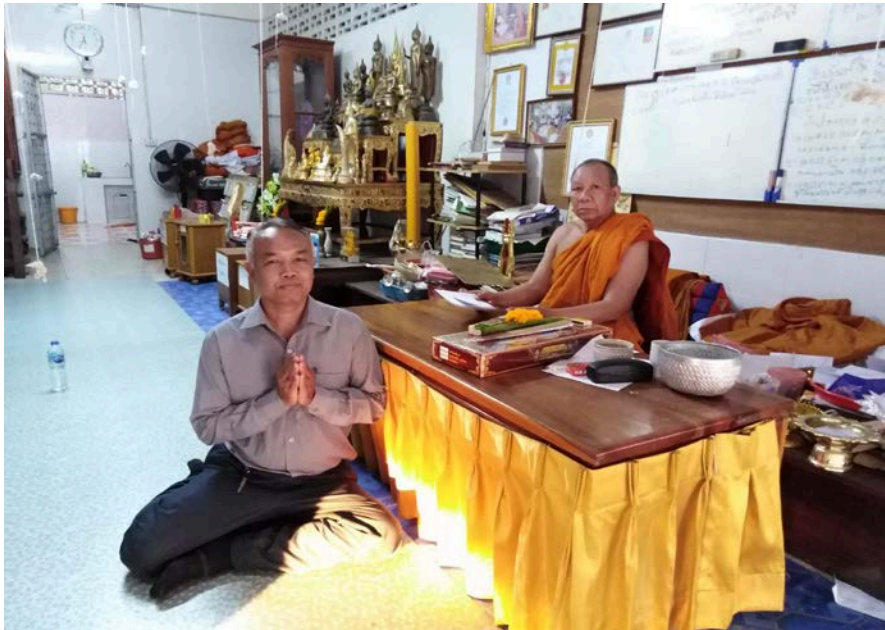
สัมภาษณ์พระครูปฐมสังฆการ,ดรเจ้าคณะอำเภอเมืองสุรินทร์ ๑๖ มกราคม ๒๕๖๒