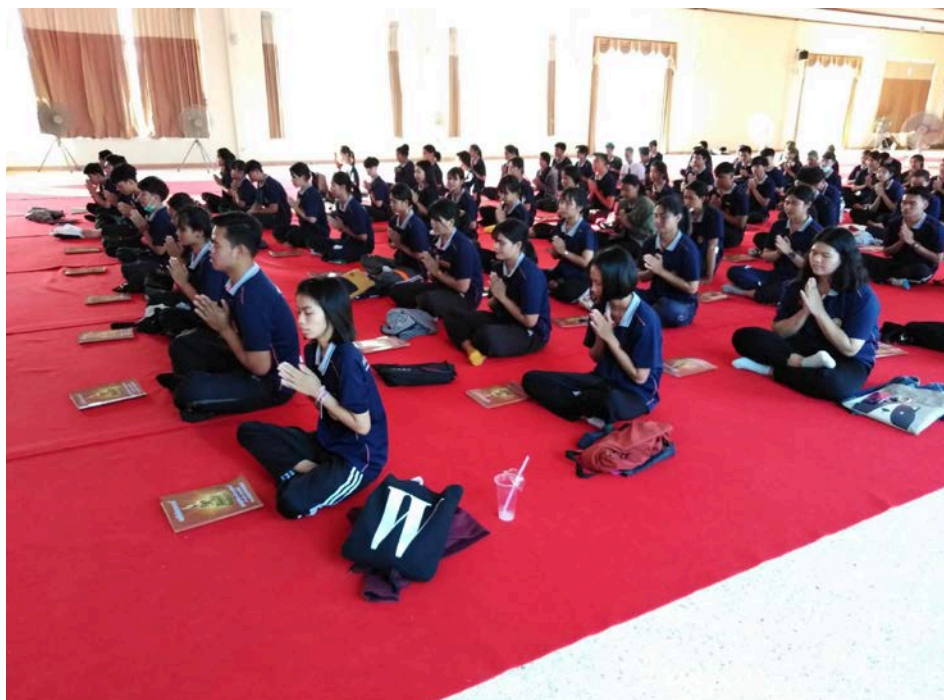
กิจกรรมเข้าฟังปฏิบัติธรรมของนักศึกษาสาขาสังคมศึกษา