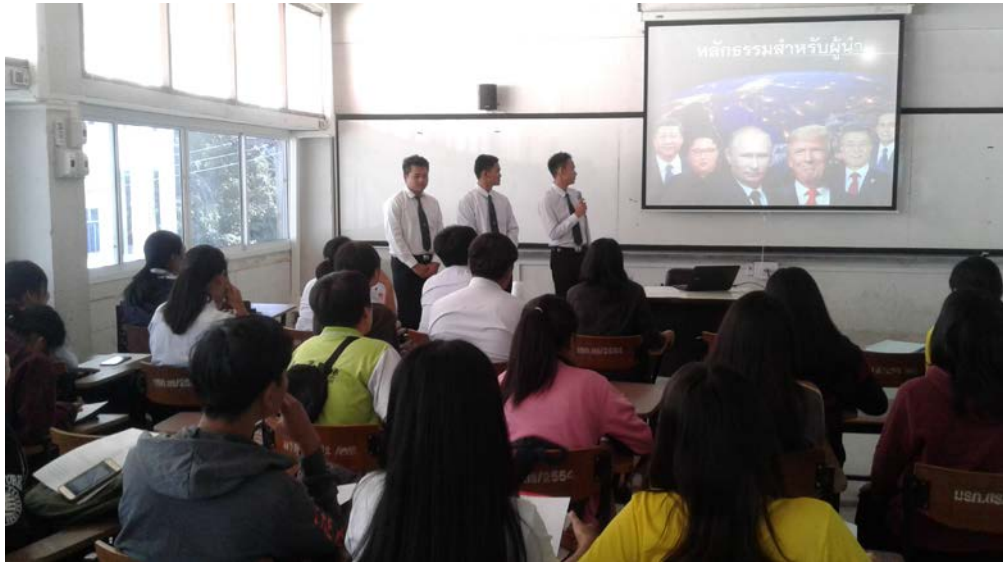
แนวทางการเสริมสร้างการเรียนรู้การสอนในหลักสูตร โดยนักศึกษานำเสนองานในรายวิชาหลักธรรมทางพระพุทธศาสนา