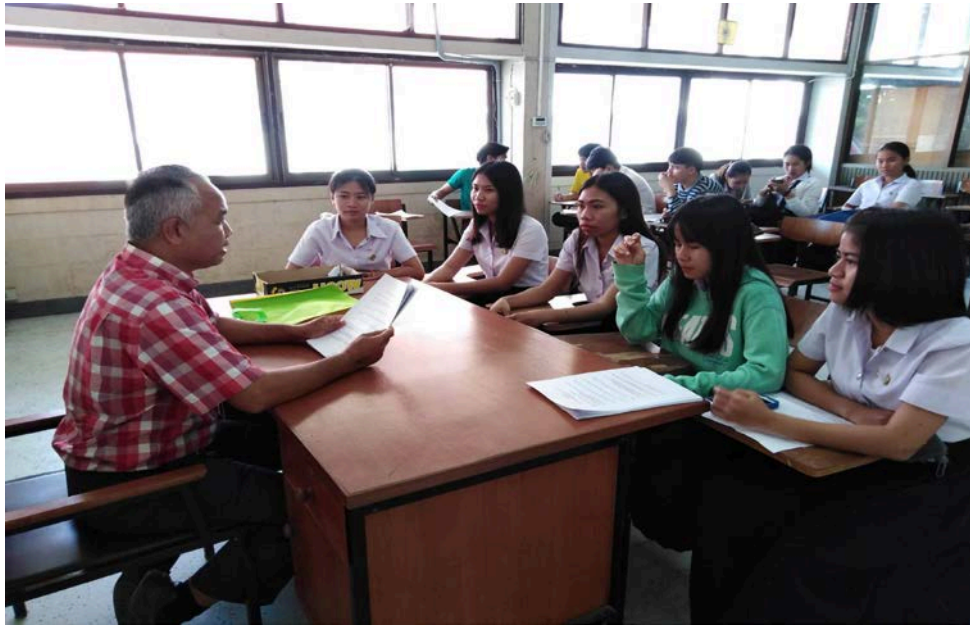
สัมภาษณ์นักศึกษาหลักสูตรครุศาสตรบัณฑิต ๑๐ มกราคม, ๒๕๖๒