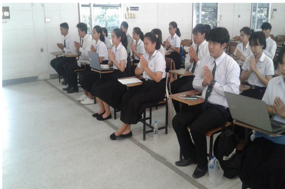
กิจกรรมสวดมนต์ไหว้พระก่อนเข้าสู่บทเรียนของนักศึกษาครุศาสตรบัณฑิต สาขาสังคมศึกษา