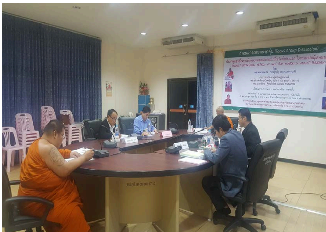
การสนทนากลุ่ม (Focus Group)