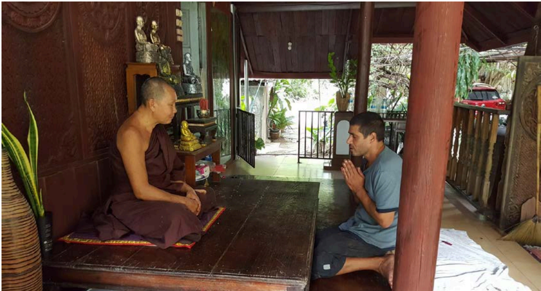
ภาพที่ ๒.๑ พระสงฆ์จะให้รับสัจจะก่อนเข้ารับการบำบัดพักฟื้นในเรือนบำบัดโดยพระผู้ให้สัจจะ

ขั้นตอนที่ ๑ พระสงฆ์จะให้รับสัจจะก่อนเข้ารับการบำบัดพักฟื้นในเรือนบำบัด โดยพระผู้ให้สัจจะจะอธิบายเรื่องสัจจะ ที่เกี่ยวกับยาเสพติดให้โทษให้ทราบจนเป็นที่เข้าใจ และให้ถวายสัจจะ ที่เกี่ยวกับยาเสพติดให้โทษให้ทราบจนเป็นที่เข้าใจ และให้ถวายสัจจะต่อองค์พระสัมมาสัมพุทธเจ้า ว่า “จะไม่สูบ ไม่เสพฝิ่น เฮโรอีน มอร์ฟิน กัญชา กระต่อม ผงขาว ยาเม็ด แลยาเสพติดทุกชนิด ตลอดชีวิต” สำหรับผู้ที่นับถือศาสนาอื่น จะให้สัจจะต่อดินฟ้าอากาศว่า “จะไม่สูบ ไม่เสพฝิ่น เฮโรอีน มอร์ฟิน กัญชา กระต่อม ผงขาว ยาบ้า ยาอี ยาเค ยาไอซ์ และสารเสพติดทุกชนิด ตลอดชีวิต”