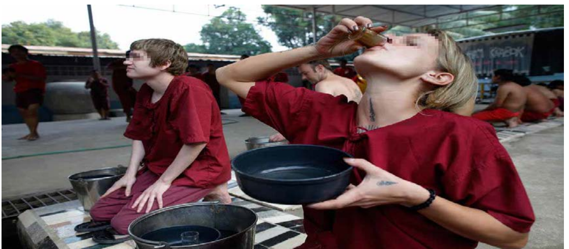
ภาพที่ ๒.๔ ผู้บ่าบัตจะต๋องทานยาสมุนไพโร