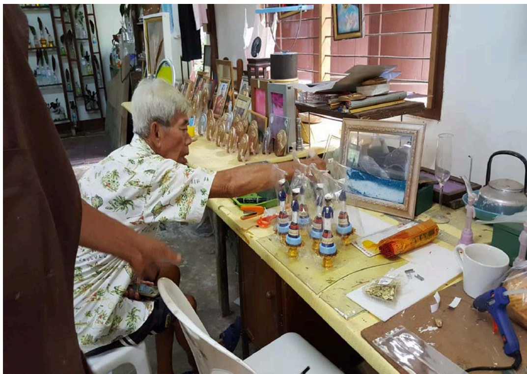
โรงฝึกงานผู้บำบัดยาเสพติด