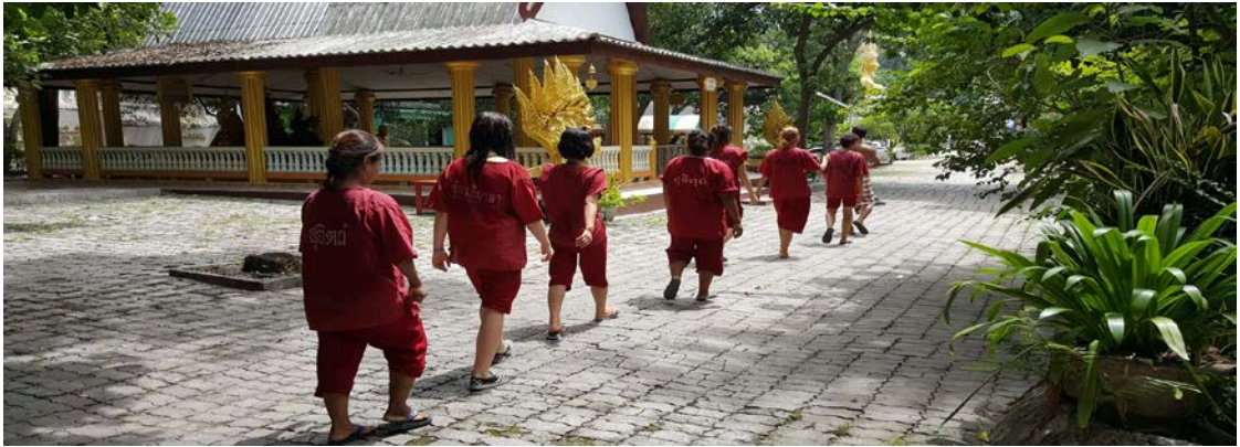
ภาพที่ ๒.๒ ผู้บ่าบัตจะต๋องทานยาสมุนไพโร(เข้าแถวเพื่อรับยาสมุนไพโร)