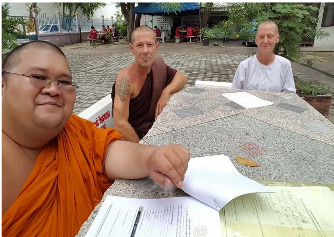
สัมภาษณ์แม่ชีเจ้าหน้าที่ผู้ประสานงานระหว่างประเทศ (เรือนบำบัตหญิง)