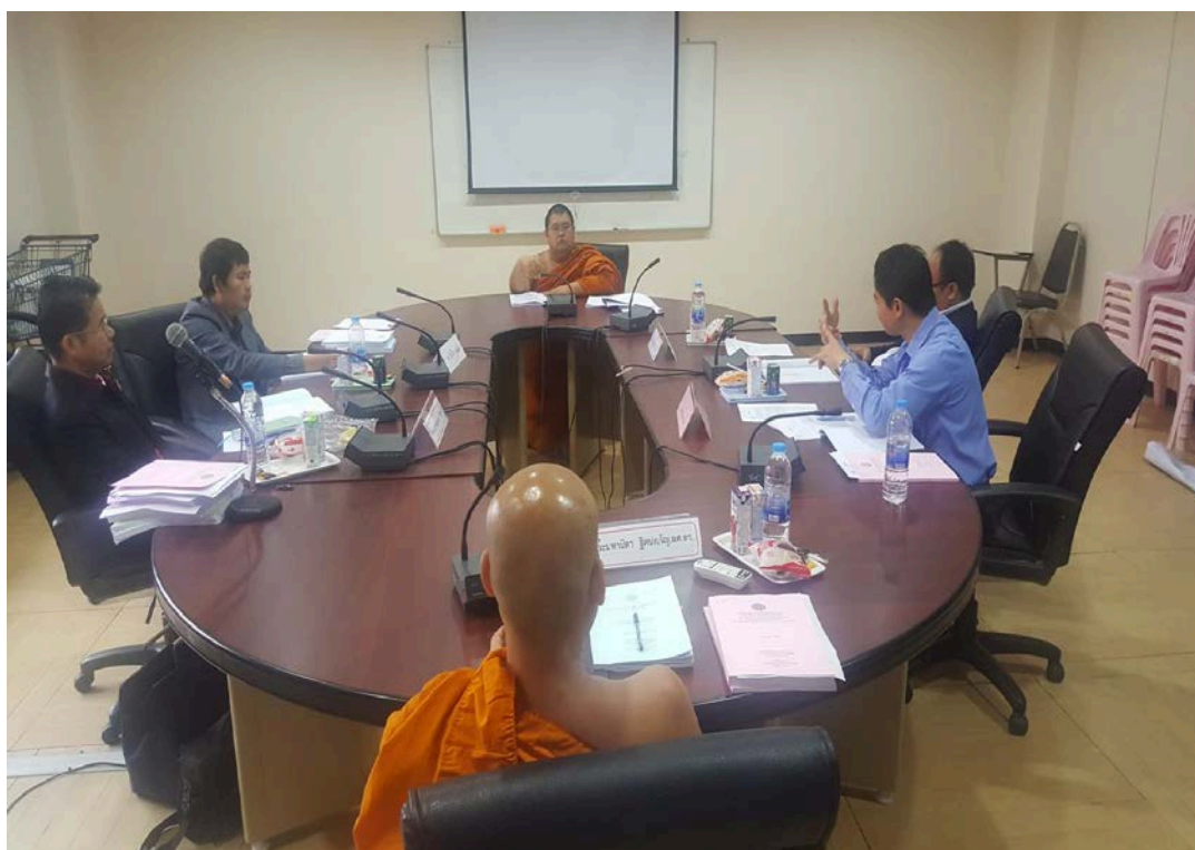
การสนทนากลุ่ม (Focus Group)