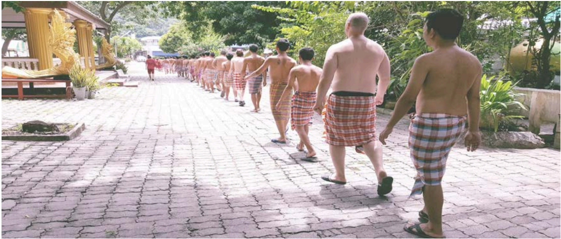
ภาพที่ ๒.๕ ผู้บ่าบัดเข้าแถวไปอบยาสมุนไพร