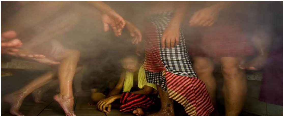
ภาพที่ ๒.๖ ผู้บ่าบัดอบยาสมุนไพร

ขั้นตอนที่ ๓ พระสงฆ์จะให้ยาสมุนไพรชนิดลูกกลอน (ยาตัดเม็ด) วันละ ๑ เม็ด ให้ผู้ป่วยรับประทานวันละครั้งจนครบ ๑๐ วันในช่วงนี้ผู้บ่าบัดจะต้องใส่เสื้อสีแดง กางเกงสีแดงเท่านั้น เพราะจะไม่ได้ควบคุมการรับประทานอาหาร ในระหว่างนี้ผู้บ่าบัดจะได้มีการสนทนา หรือฟังธรรมจากพระผู้ดูแลทุกๆ วัน หลังจากเคารพธงชาติในตอนเย็นเสร็จ ในช่วงนี้จะมีการทบทวนข้อปฏิบัติต่างๆ นันทนาการ ฟังธรรมะจากพระผู้ดูแล และซักถามอาการของผู้บ่าบัดตลอดจนถึงปัญหาข้อสงสัยต่างๆ