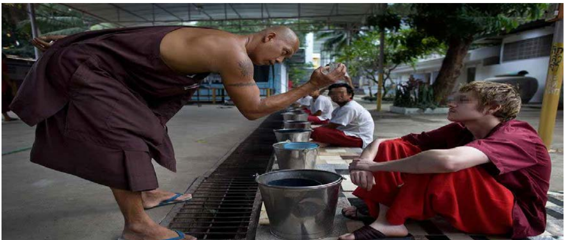
ภาพที่ ๒.๓ ผู้บ่าบัตจะต๋องทานยาสมุนไพโร