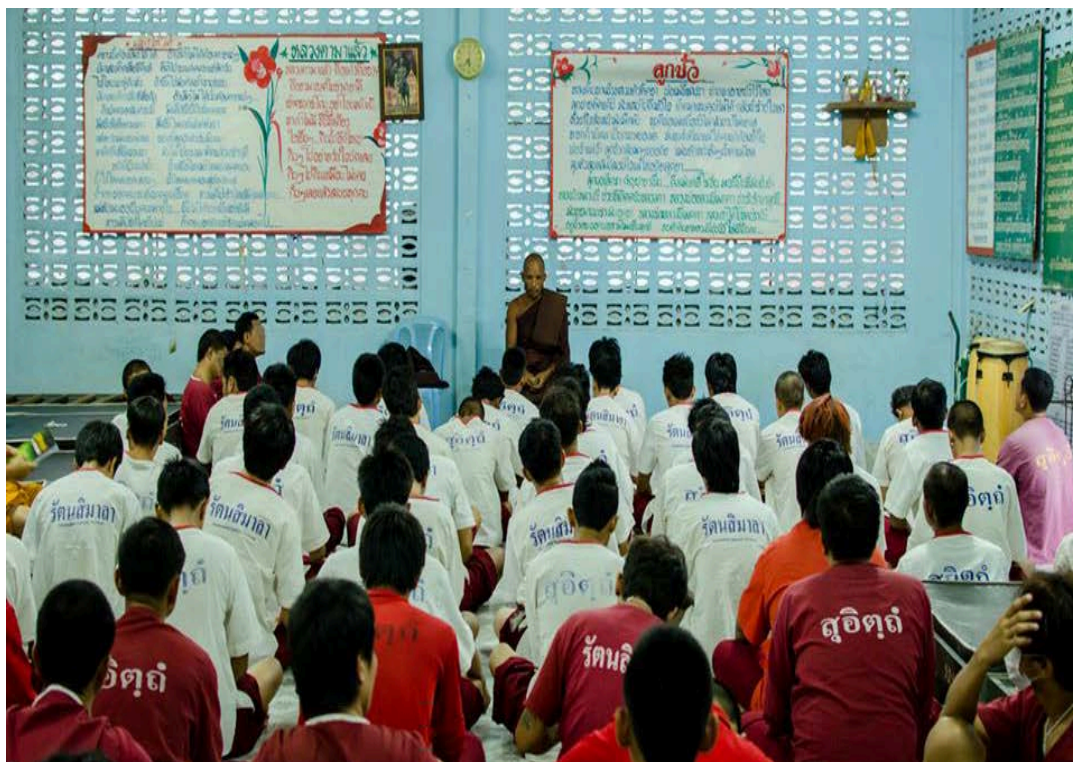
กิจกรรมฟังธรรมบรรยายจากพระอาจารย์เจ้าหน้าที