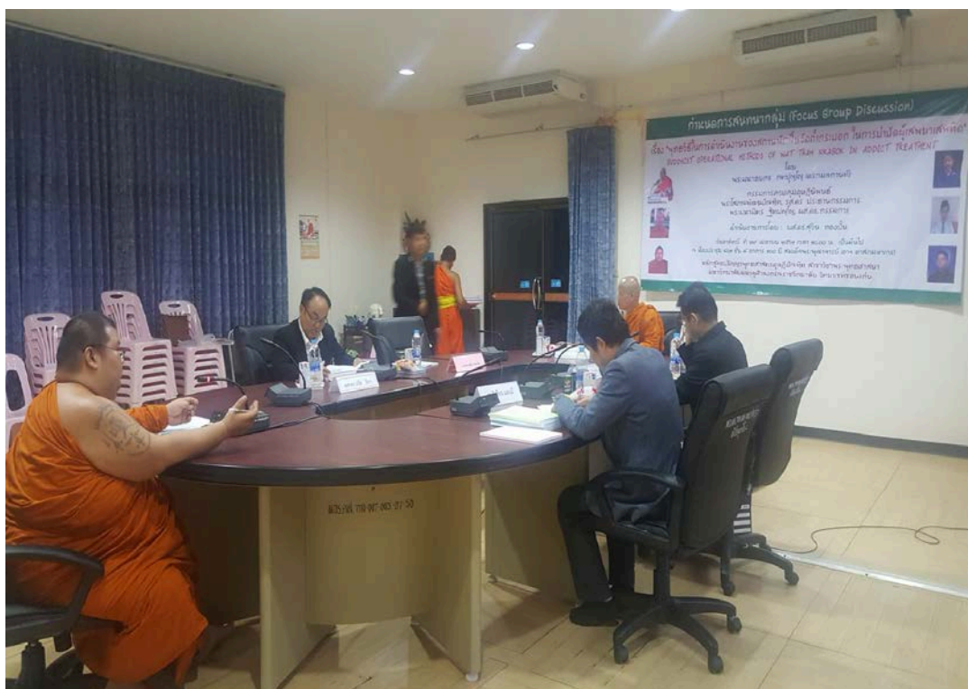
การสนทนากลุ่ม (Focus Group)