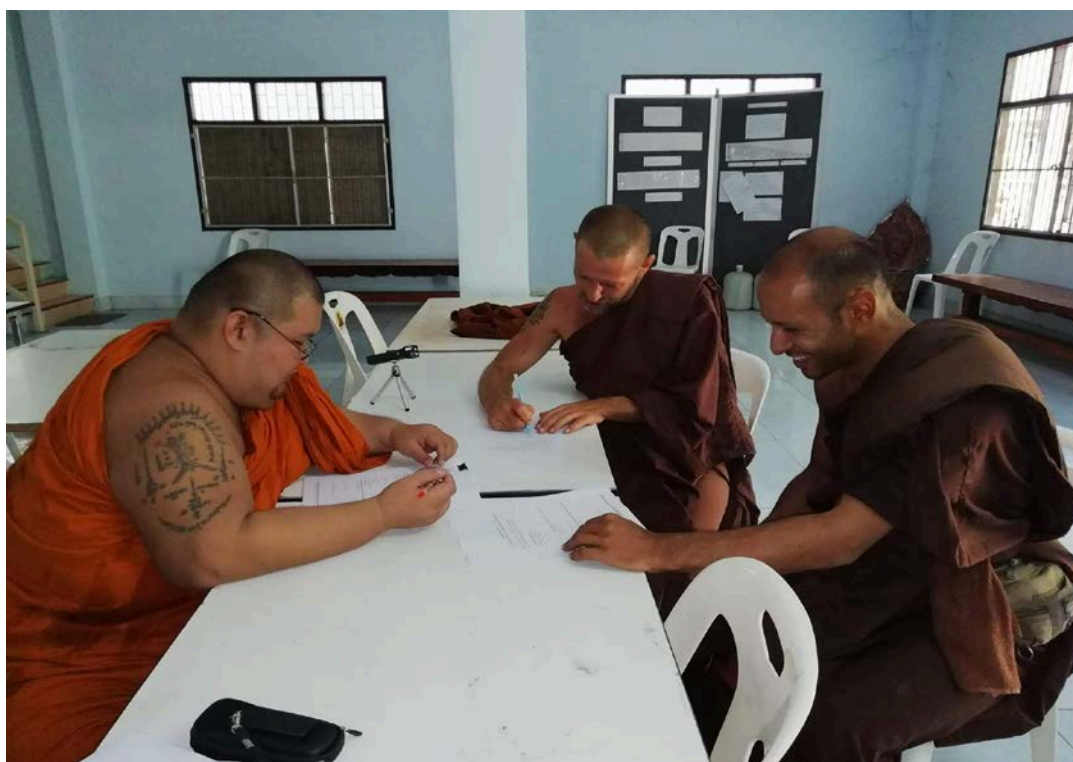
สัมภาษณ์พระเจ้าหน้าที่ผู้ประสานงานระหว่างประเทศ (เรือนบำบัตชาย)