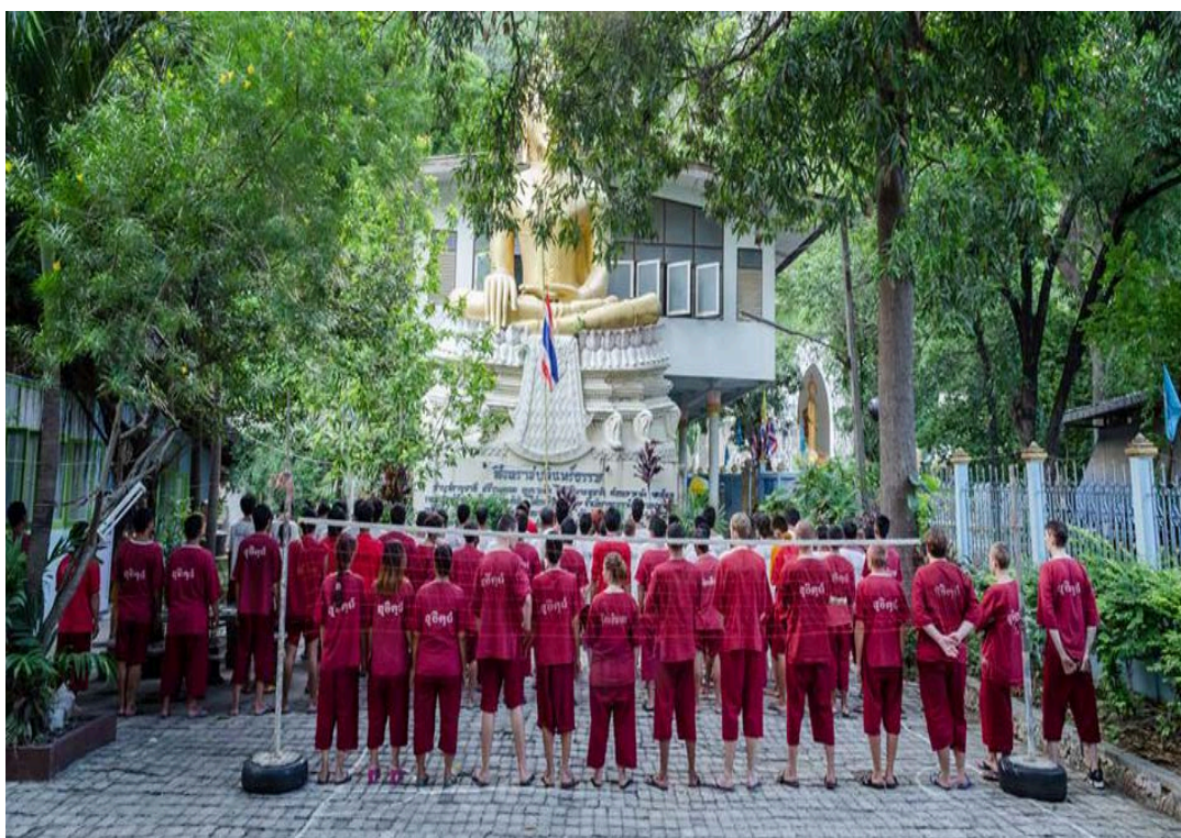
กิจกรรมเคารพธงชาติ และฟังโอวาสจากพระอาจารย์เจ้าหน้าที