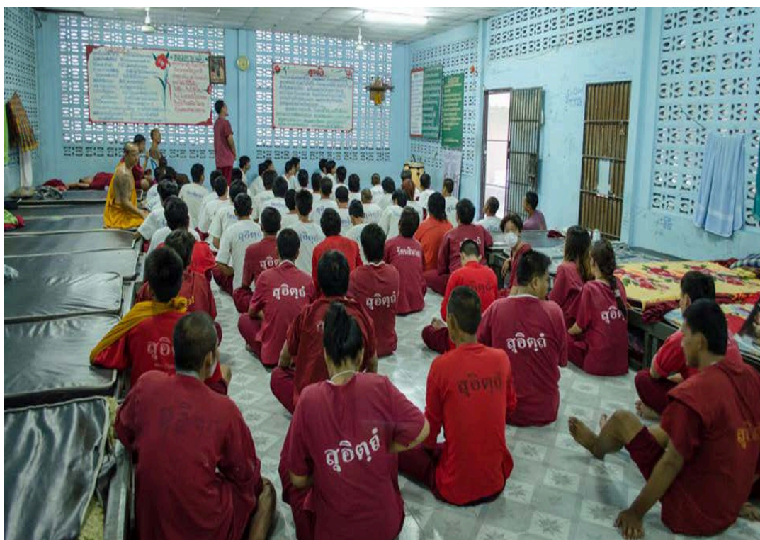
ผู้บำบัดยาเสพติดกับกิจกรรมนันทนาการ