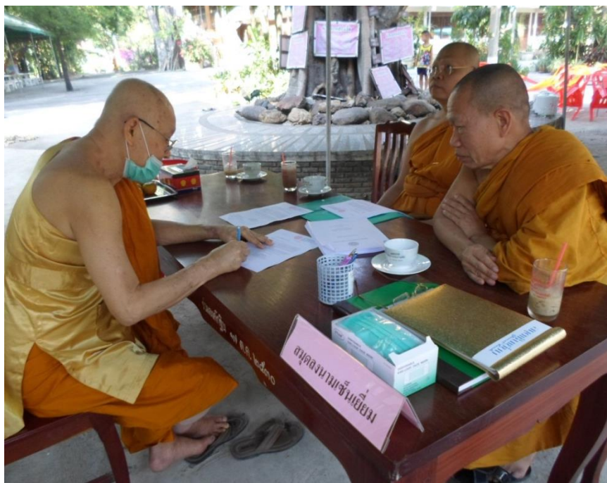
สัมภาษณ์พระมงคลกิตติวิบูลย์ รองเจ้าคณะจังหวัดสุพรรณบุรี, วันที่ ๑๕ กุมภาพันธ์ ๒๕๖๐