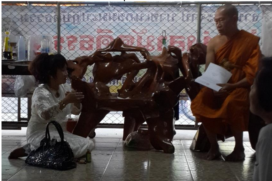
สัมภาษณ์ พันโทหญิง ธนตศกร บุราคม เลขาเครือข่ายสถานิติบัญญัติ แห่งชาติ วันที่ ๑๗ กุมภาพันธ์ ๒๕๖๐