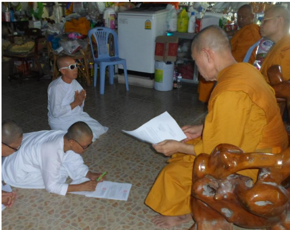
สัมภรณ์แม่ชีลำปางค์ สังข์บุรินทร์, วันที่ ๑๕กุมภาพันธ์ ๒๕๖๐.