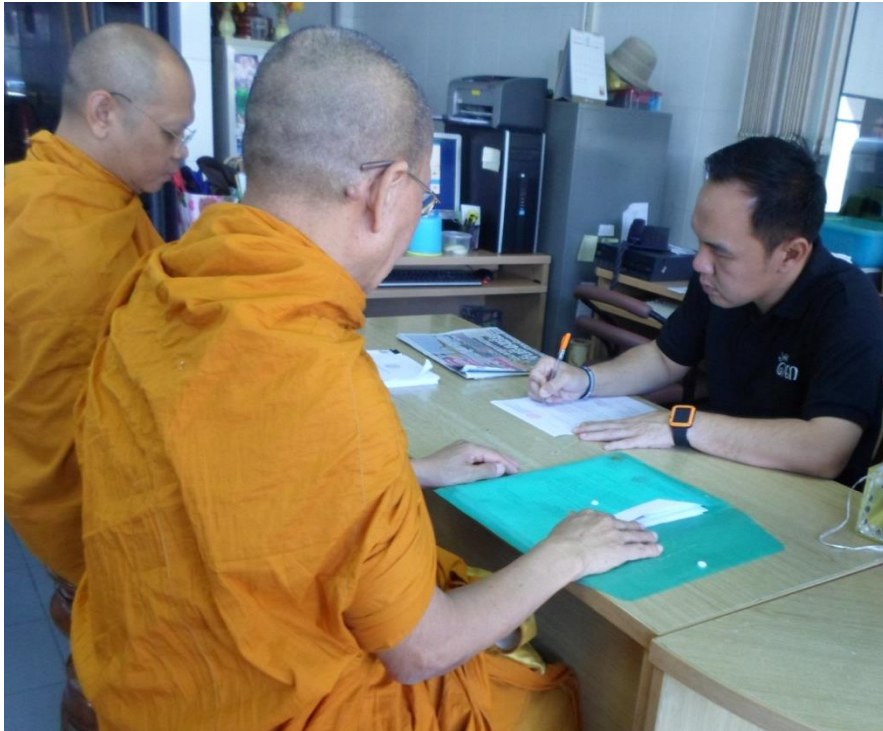
สัมภาษณ์ นายอิทธิภัทร์ โภควรรณวิทย์ รองนายกเทศมนตรีสามชุก วันที่ ๑๗ กุมภาพันธ์ ๒๕๖๐