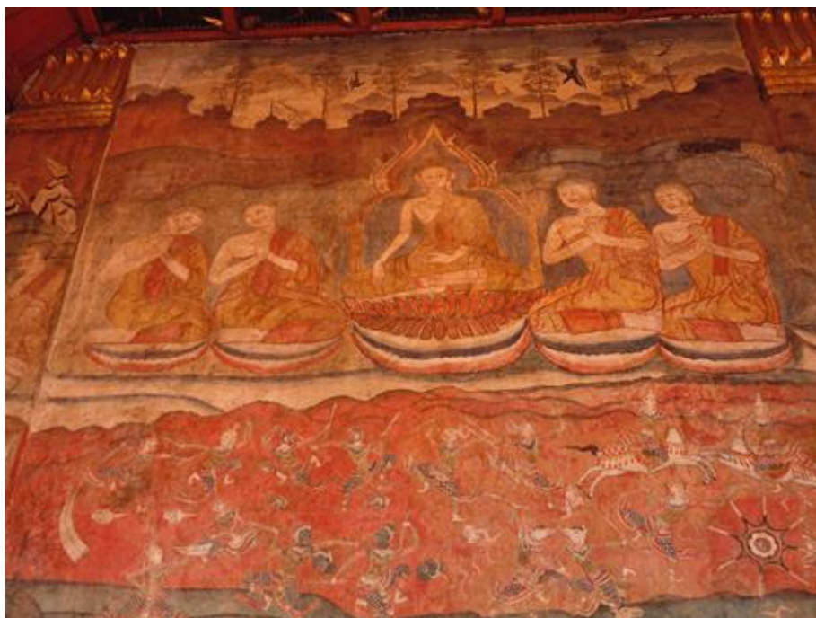
รูปภาพที่ ๖ เป็นผนังด้านทิศใต้ ของวิหารวัดพนม เป็นรูปพระพุทธเจ้าประทับนั่งปางมารวิชัย มีพระสาวกนั่งประนมมืออยู่ด้านข้าง ตอนที่พระพุทธเจ้าทรงแสดงธรรมเทศนาเล่าเรื่องคันทนกุมารชาดก