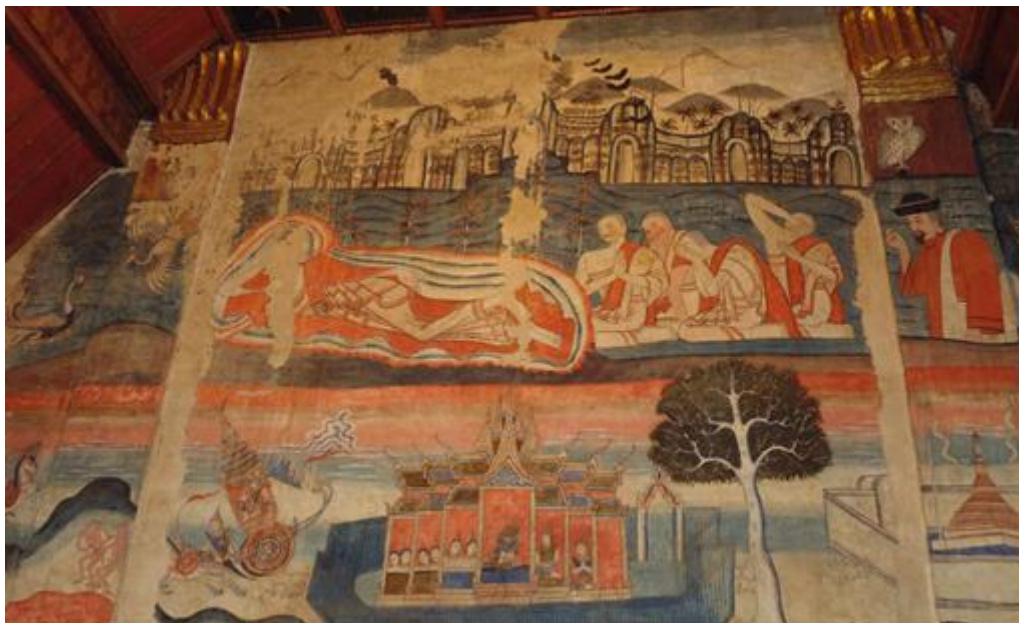
รูปภาพที่ ๔ ด้านบน, รูปที่ ๕ ด้านล่าง เป็นผนังด้านทิศตะวันตกของวิหารวัดภูมินทร์ ด้านบนเขียนเป็นภาพพระพุทธเจ้าในปางปรินิพพาน ล้อมรอบด้วยพระสาวกที่แสดงอาการเศร่ำโศก ส่วนผนังด้านล่างเขียนเรื่องเนมิราชชาดก