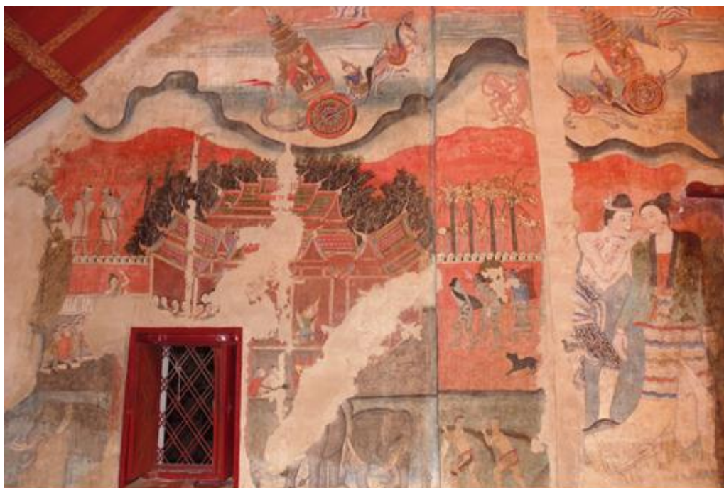
รูปภาพที่ ๕ ด้านบน