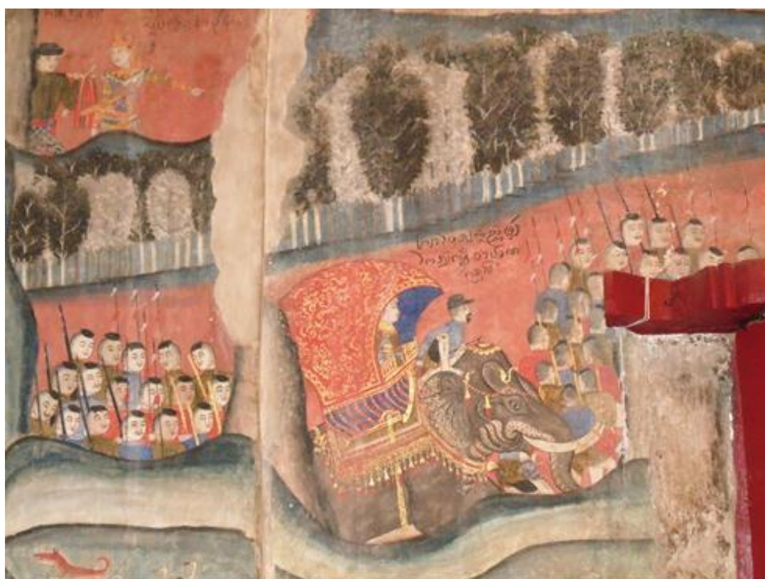
รูปภาพที่ ๙ ด้านบน เล่าเรื่องคันทนกุมารชาดก