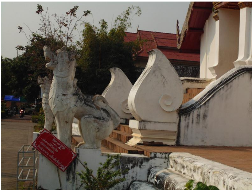
ภาพที่ ๕ ในขณะที่บันไดทางทิศตะวันตกและตะวันออกเป็นรูปตัวหงา