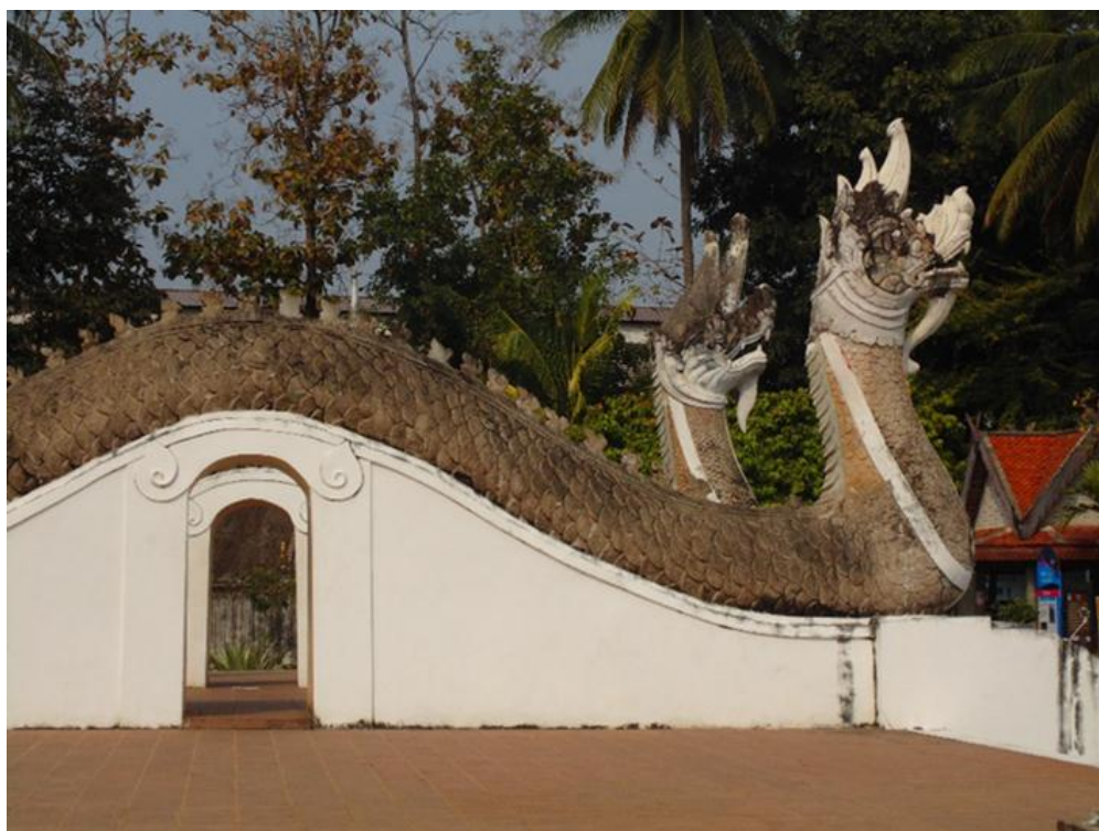
ภาพที่ ๖ เสน่ห์ของวัดภูมินทร์อีกจุดหนึ่งคือ ส่วนลำตัวพญานาคด้านทิศเหนือและได้ยกสูงขึ้นทำเป็นซุ้มประตูโค้งเพื่อให้เดินผ่านทะลุได้