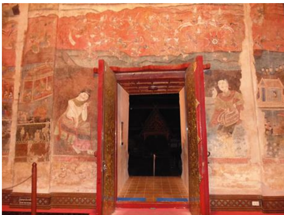
รูปภาพที่ ๗ ด้านบนห่มสาวชาวเมืองแต่งตัวเต็มยศกับวัฒนธรรมการสืบทอดหรือซิการ์ของชาวล้านนา