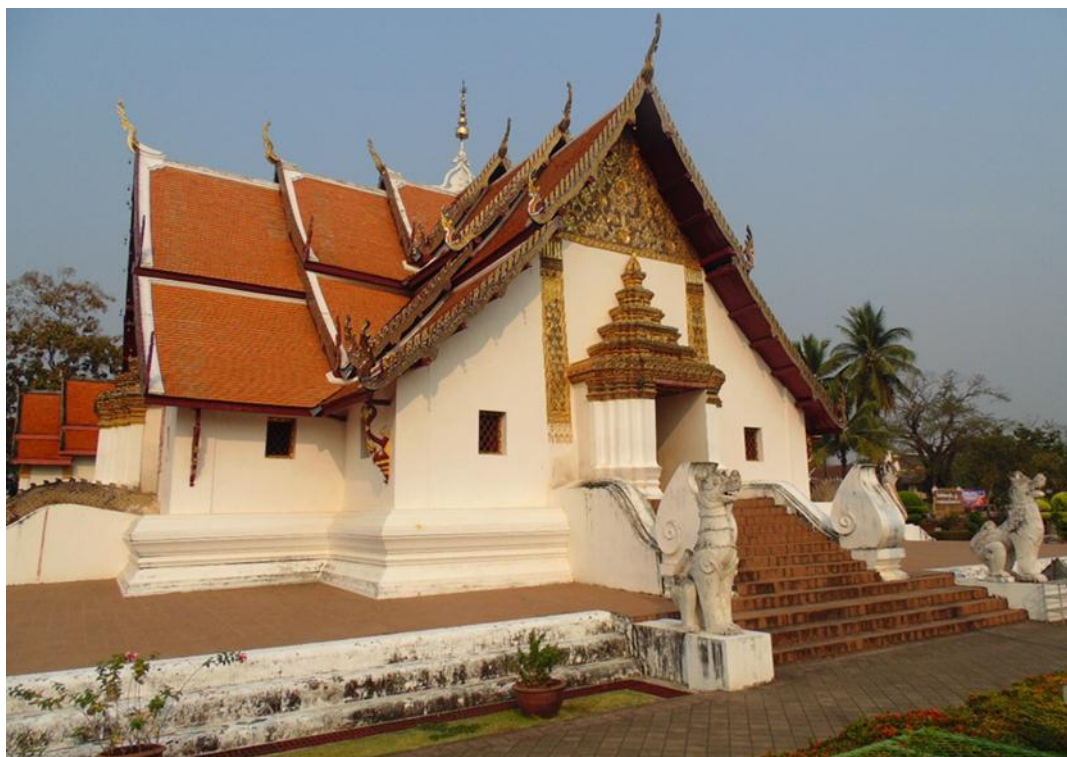
ภาพที่ ๓ หน้ามุขพระอุโบสถด้านทิศตะวันออกกลางลำตัวพญานาค