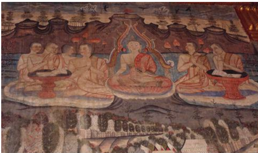
รูปภาพที่ ๘ ด้านบน เป็นผนังด้านทิศตะวันออก ของวิหารวัดถุนินทร์ เป็นรูปพระพุทธเจ้าประทับนั่งปางมารวิชัย ตอนที่พระพุทธเจ้าทรงแสดงธรรมเทศนาเล่าเรื่องคันทนกุมารชาดก