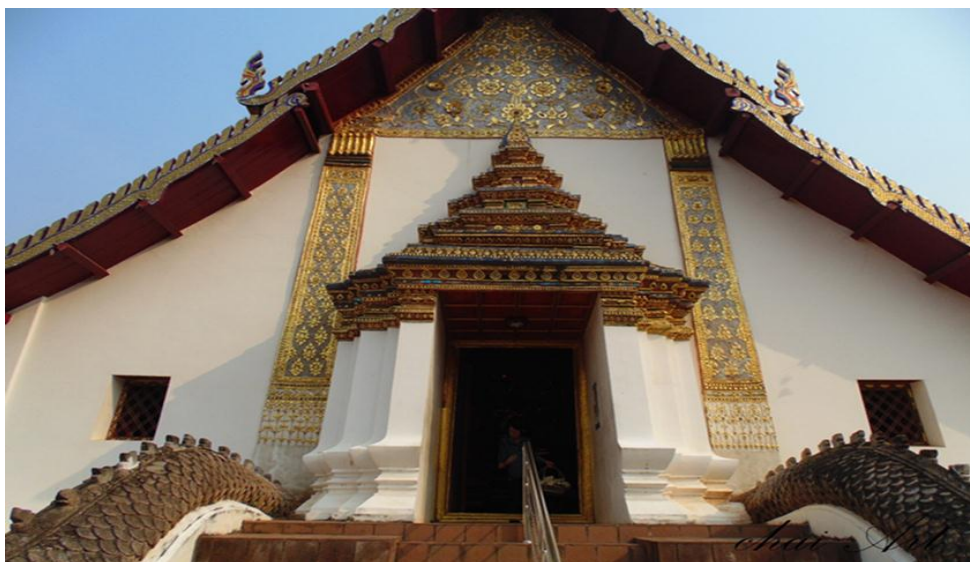
ภาพที่ ๑ ลักษณะคล้ายตัวอาคารวางอยู่บนนาคสองตัวที่วางตัวตามแนวทิศเหนือ-ใต้ โดยส่วนหัวนาคอยู่ทางทิศเหนือบันไดทางขึ้นสู่วิหารมีทั้งสี่ด้าน