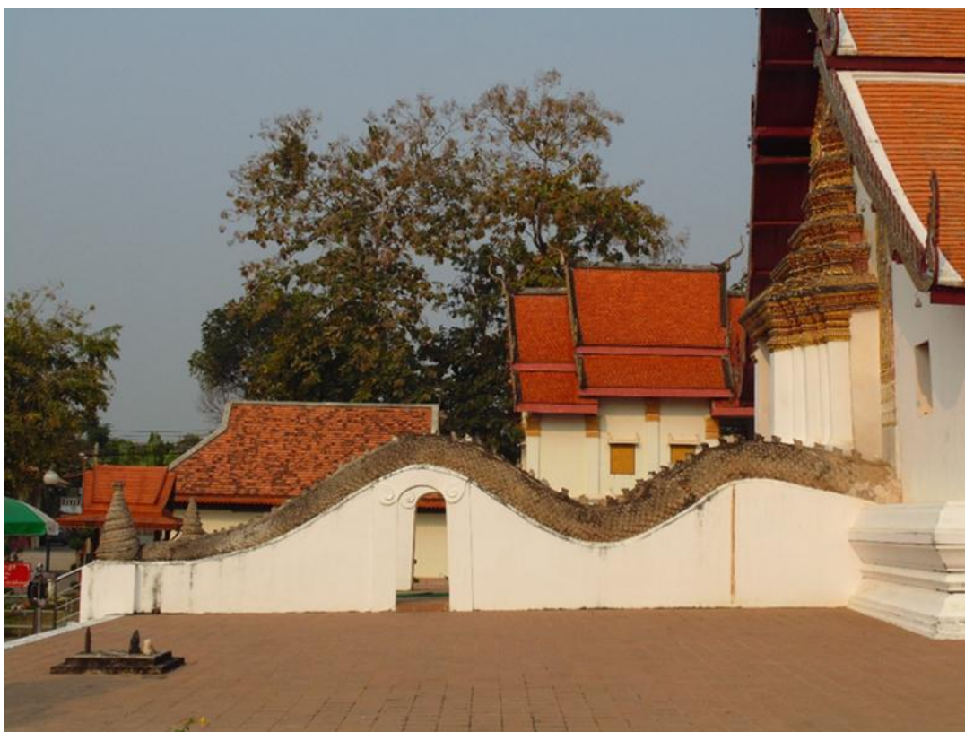
ภาพที่ ๔ ส่วนของหางพญานาคด้านทิศใต้