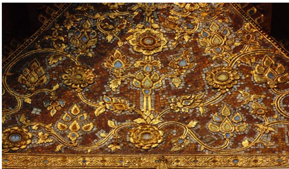
ภาพที่ ๑๔ ลายประดับหน้าบันพระอุโบสถทุกด้านเป็นลายก้านต่อดอก ก้านเหล่านี้วางเลื้อยไปตามจันทระและพื้นที่ของทรงสามเหลี่ยม ปลายก้านประดับด้วยลายดอกทรงไบเทศหรือลายดอกกลมบริเวณกลีบดอกประดับกระจกสีต่างๆกัน โดยพื้นหลังของหน้าบันทั้งหมดประดับกระจกสีเงิน ถึงแม้ว่าลายดอกต่างๆนั้นจะมีอิทธิพลภาคกลางอยู่มาก แต่เทคนิคการประดับกระจกสีเป็นลักษณะท้องถิ่น ซึ่งอาจได้รับอิทธิพลจากศิลปะลาวที่หลวงพระบางอยู่บ้าง เป็นลายปูนปั้นประดับกระจก