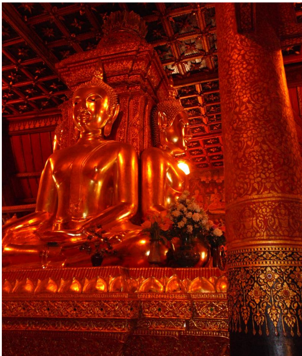
ภาพที่ ๑๗ เหนือแกนกลางที่พระปฤษฎางค์ของพระพุทธรูปชนกัน เป็นเสารับน้ำหนักหลังคา ซึ่งวิหารที่มีเสากลางรับน้ำหนักหลังคาแบบนี้ เป็นโครงสร้างอาคารที่นิยมสร้างกันมากในศิลปะพม่าที่พุกามตั้งแต่ราวพุทธศตวรรษที่ ๑๗ เป็นต้นมา