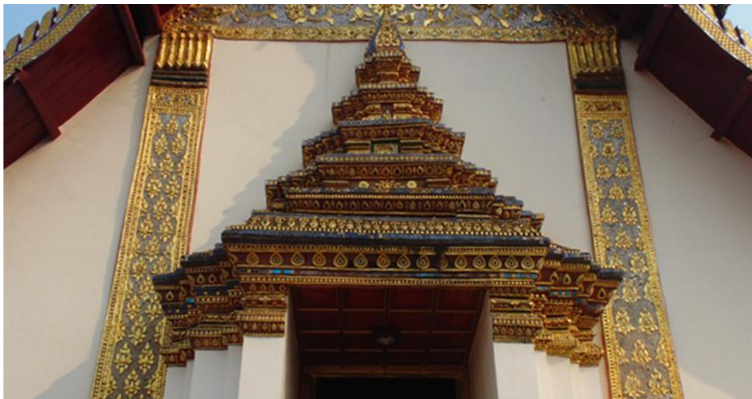
ภาพที่ ๑๓ ที่เสาชานบาลข้างซุ้มประตูทุกด้าน มีลายปูนปั้นประดับกระจกเป็นลายพุ่มไบเทศ ด้านล่างสุดมีลายกรวยเชิง เข้าใจว่าได้รับอิทธิพลของศิลปะรัตนโกสินทร์