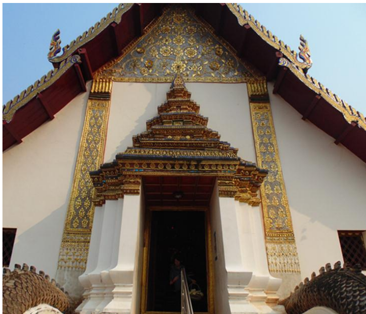
ภาพที่ ๑๑ ลักษณะที่เป็นแบบท้องถื่นได้แก่ ตัวโคงที่มีแผนผังยกเก็จมากกว่าการย่อมุม ส่วนยอดที่เป็นชั้นลดซึ่งเลียนแบบจากตัวประตูด้านล่าง แต่ทำช่องว่างระหว่างชั้นสั้นมากเพราะต้องการให้คล้ายชั้นลดของภาคกลาง