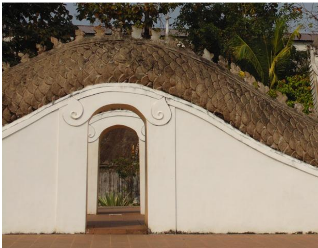
ภาพที่ ๗ มีความเชื่อกันว่าหากใครลอดซุ้มประตูใต้ลำตัวพญานาคนี้แล้วจะได้กลับมาเมืองน่านอีก