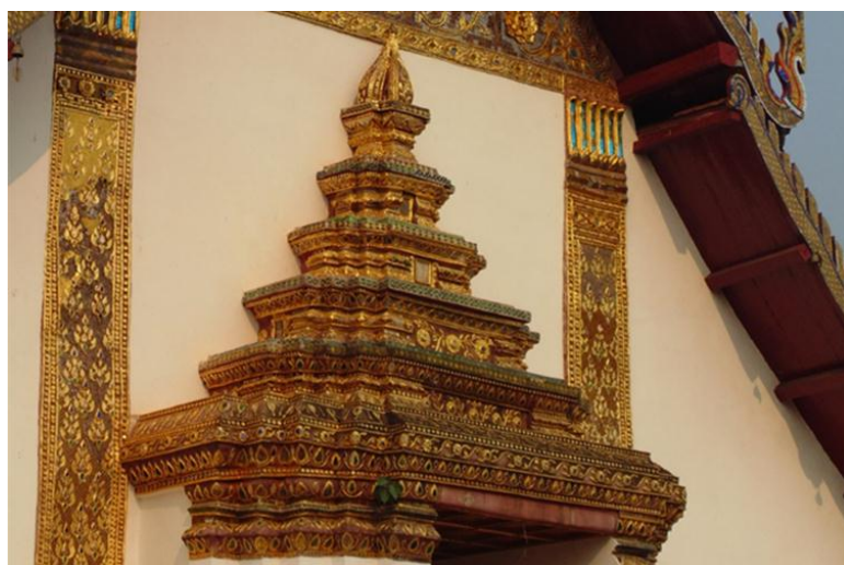
ภาพที่ ๑๒ ตลอดจนยอดรูปบัวตูมซึ่งแตกต่างจากเรือนยอดซุ้มประตูภาคกลางอย่างชัดเจน ส่วนลายปูนปั้นประดับกระจกยังคงลักษณะลายท้องถื่นได้เกือบทั้งหมด