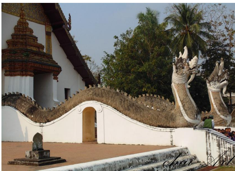
ภาพที่ ๒ โดยด้านทิศเหนือมีราวบันไดรูปพญานาค ทอดลำตัวพาดผ่านพระอุโบสถและทางพญานาค ผ่านออกมาหน้ามุขด้านทิศใต้