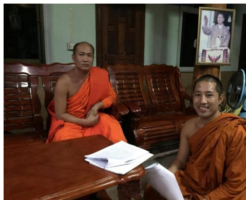
พระครูพิพิธธมฺมการ เจ้าอาวาสวัดแม่สุก