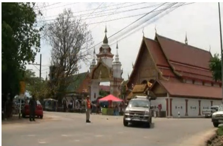
สถานที่ตั้งกลุ่มสัจจะออมทรัพย์ชุมชนบ้านแม่ใส วัดแม่ใส ตำบลแม่ใส อำเภอเมือง จังหวัดพะเยา