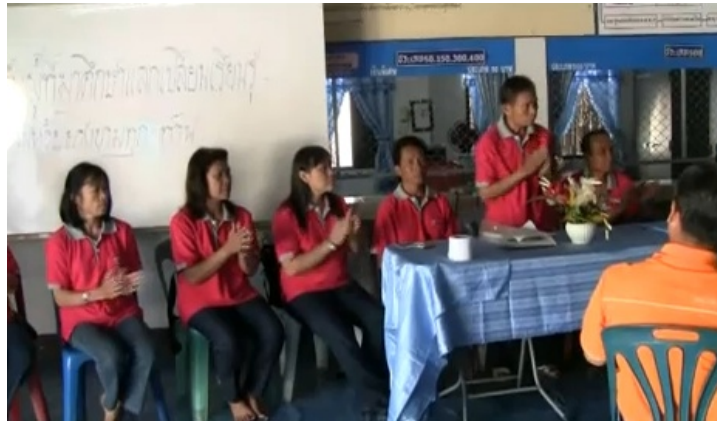
การเลือกตั้งคณะกรรมการบริหารกลุ่มสัจจะออมทรัพย์