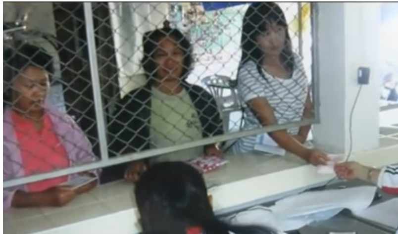
สมาชิกกลุ่ม ๗ นำเงินสะสมมาฝาก