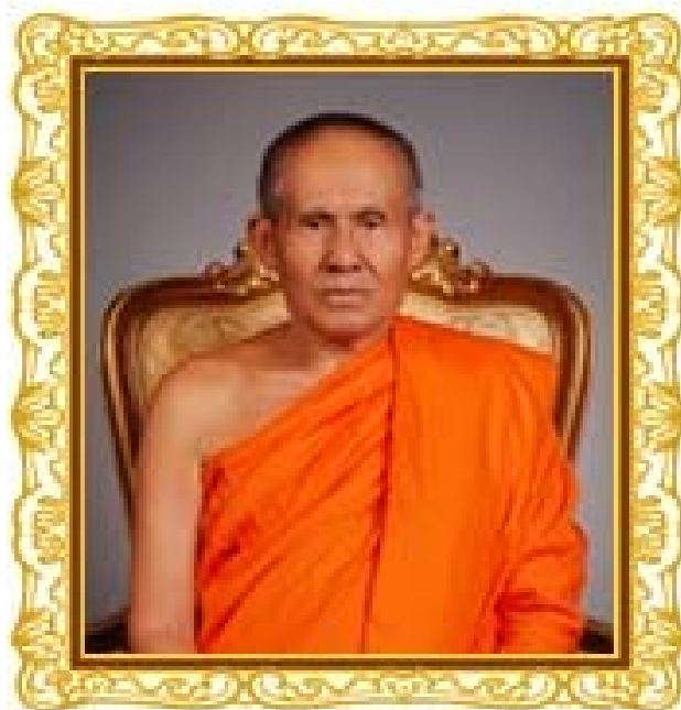
พระราชวิริยาภรณ์ เจ้าคณะจังหวัดพะเยา ผู้ก่อตั้งกลุ่มสัจจะออม