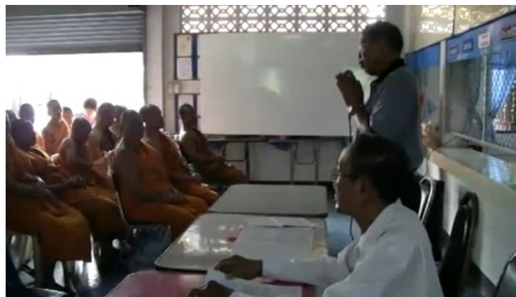
การถ่ายทอดความรู้แก่พระสงฆ์ที่มาศึกษาดูงาน กลุ่มสัจจะออมทรัพย์ชุมชนบ้านแม่ไธ