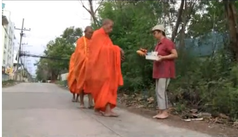
ชุมชนสงบสุขร่มเย็นเพราะร่มธรรม