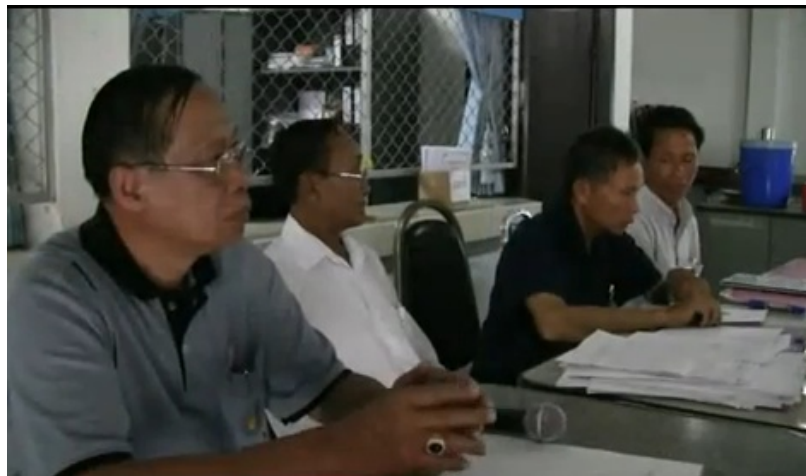
คณะกรรมการกลุ่มสี่จะออมทรัพย์ฯ