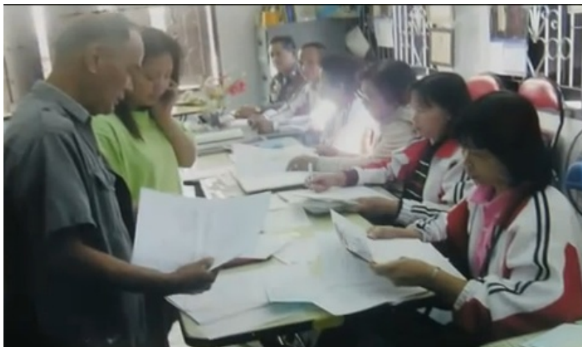
สมาชิกกลุ่ม ยื่นสมัครเป็นสมาชิก และ ยื่นเอกสารการกู้ยืม