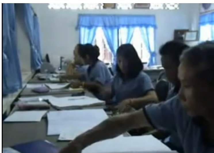
การจ้ดการการมีส่วนร่วมของสมารคกลุ่มส้จจะอมทรรพ์ ชุมชนบ้านแม่ใส