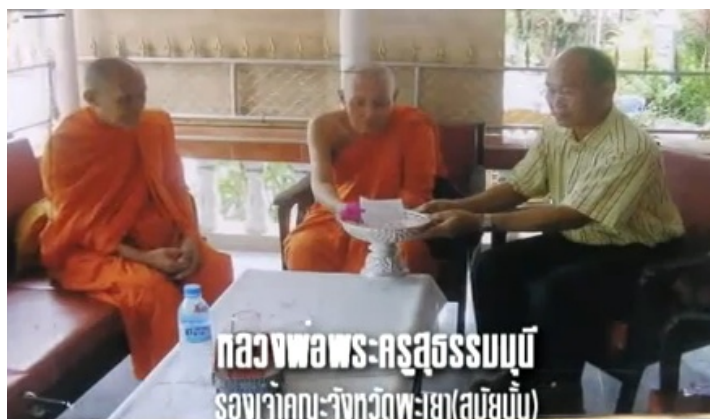
ถวयरยช้อ สมารคกลุ่มส้จจะอมทรรพ์